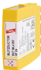
Zobrazení je nezávazné