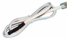
Temp-1Wire 1m 600 242