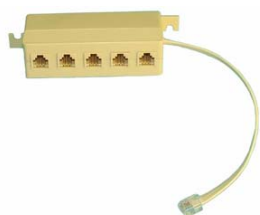
Poseidon T-Box 600 040