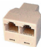
Poseidon T-Box2 600 280