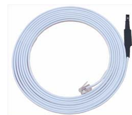
Humid-1Wire 3m 600 279