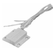
Door Contact 600 119