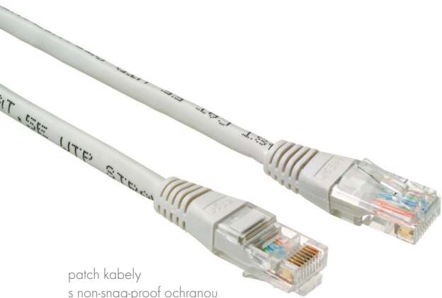
patch kabely s non-snag-proof ochranou